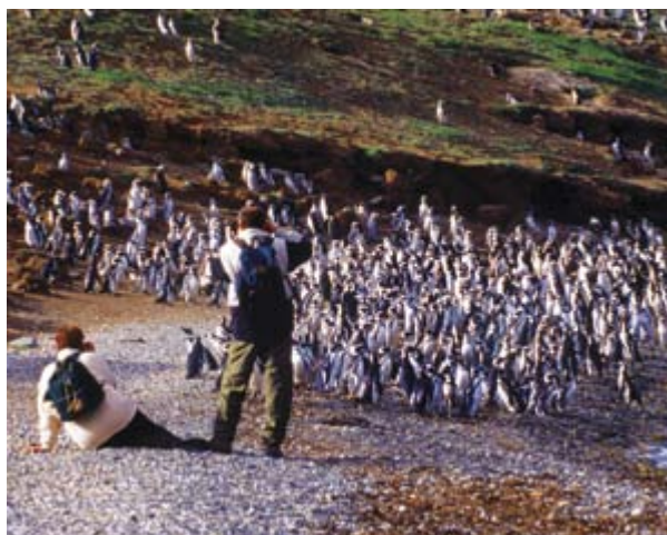
Arriba Cementerio Municipal de Punta Arenas. Centro Avistamiento de ballenas. Abajo Pingüinos en Estrecho de Magallanes.