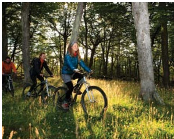
Arriba Glaciar Grey, Parque Nacional Torres del Paine. Centro Cueva del Milodón. Abajo Mountain bike en cerro Balmaceda.