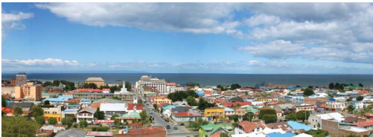
Abajo Punta Arenas.